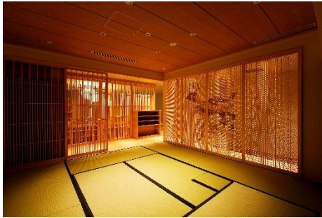
《2F ソーシャルコーナー「TATAMI」》