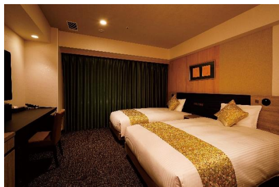
《スーペリアツイン》