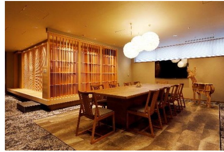
《2F ソーシャルコーナー「TSUKUE」》