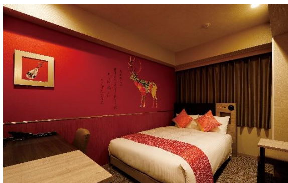
《スタンダードダブル》